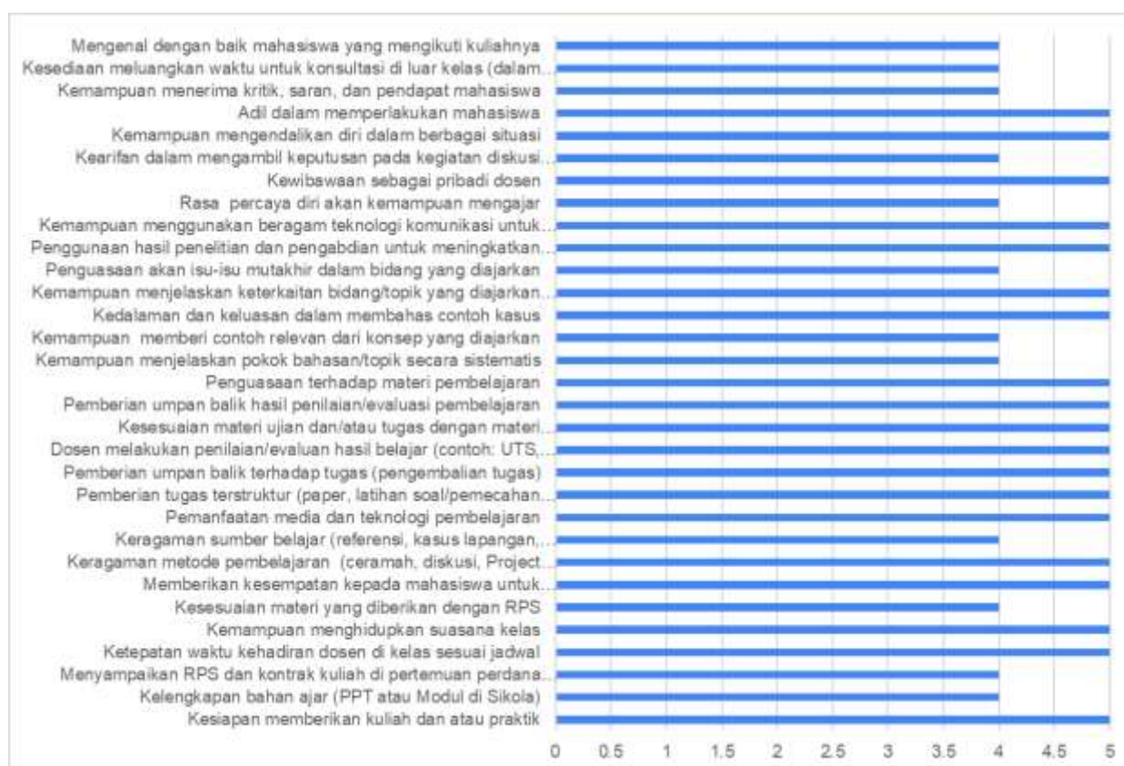
Gambar 2. Grafik respon mahasiswa terhadap pertanyaan Kuisioner

Gambar 2 menunjukkan grafik respon mahasiswa terhadap 37 indikator penilaian. Hasilnya menunjukkan bahwa respon mahasiswa terhadap mata kuliah Kebijakan dan Strategi Perikanan mencapai nilai skor rata-rata 4.6 dari skor maksimal 5 atau penilaian berada pada kisaran nilai 4 hingga 5. Skor penilaian yang menunjukkan proses pembelajaran baik dan lancar. Tetapi jumlah responden yang masih sangat rendah belum sepenuhnya memberikan gambaran yang utuh terhadap proses pembelajaran pada mata kuliah ini. Memerlukan perhatian dan partisipasi para dosen pengampu matakuliah untuk mengarahkan mahasiswa peserta mata kuliah dalam pengisian kuisioner evaluasi pembelajaran. Sehingga dapat diketahui proses pembelajaran berjalan baik atau tidak.